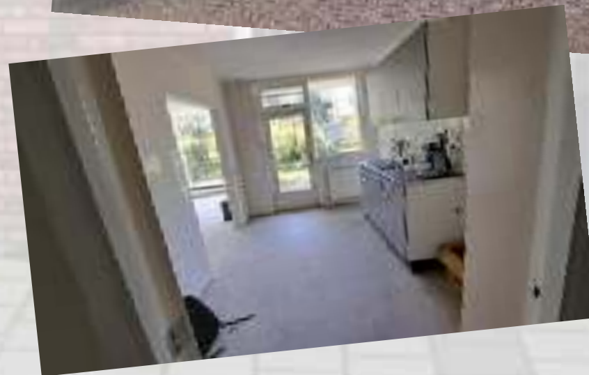
De Ridder van Catsweg