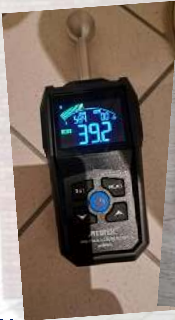
Vochtmeetapparatuur voor controle op natte muren en vloeren (schimmel)