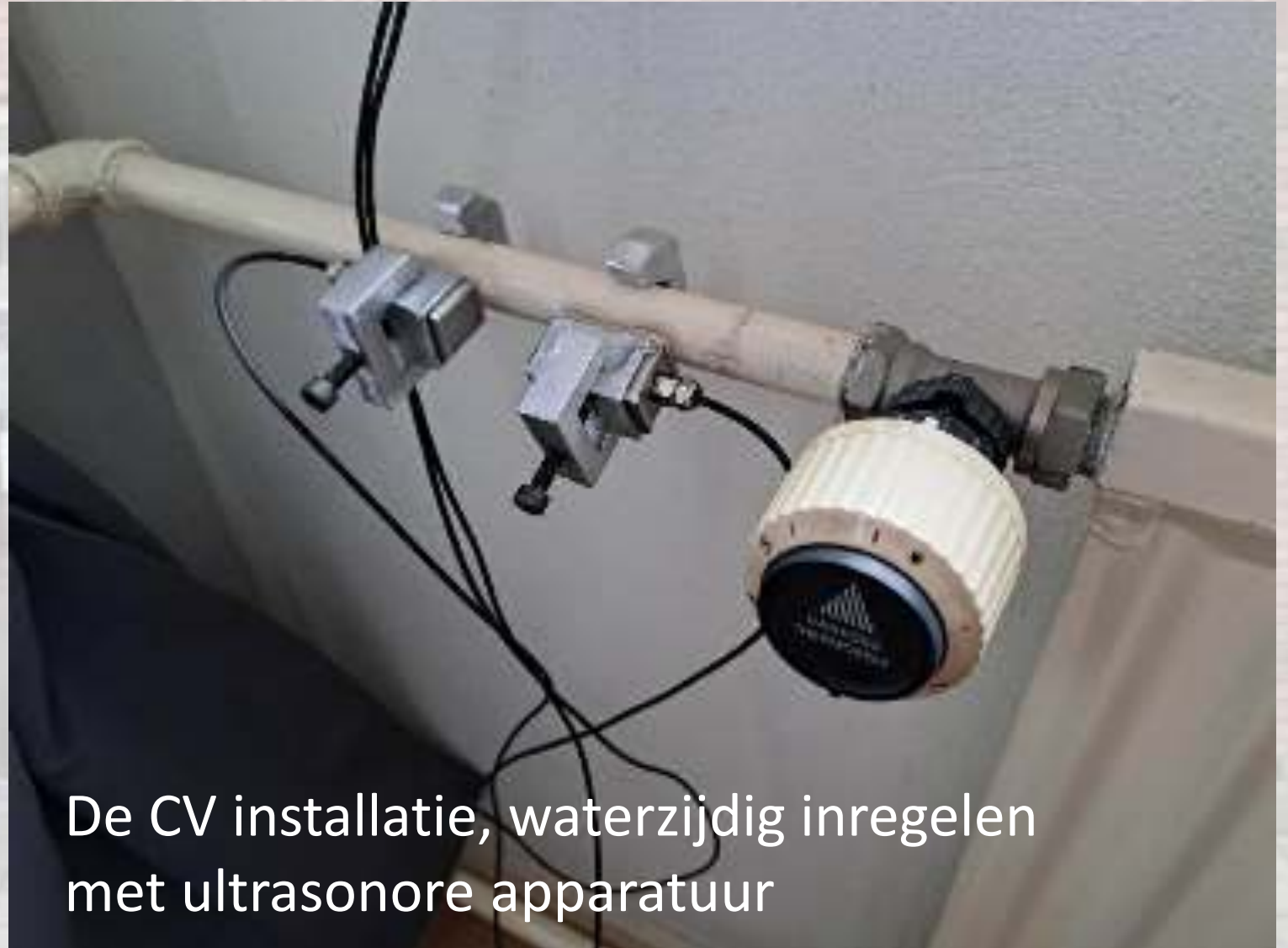
De CV installatie, waterzijdig inregelen met ultrasonore apparatuur